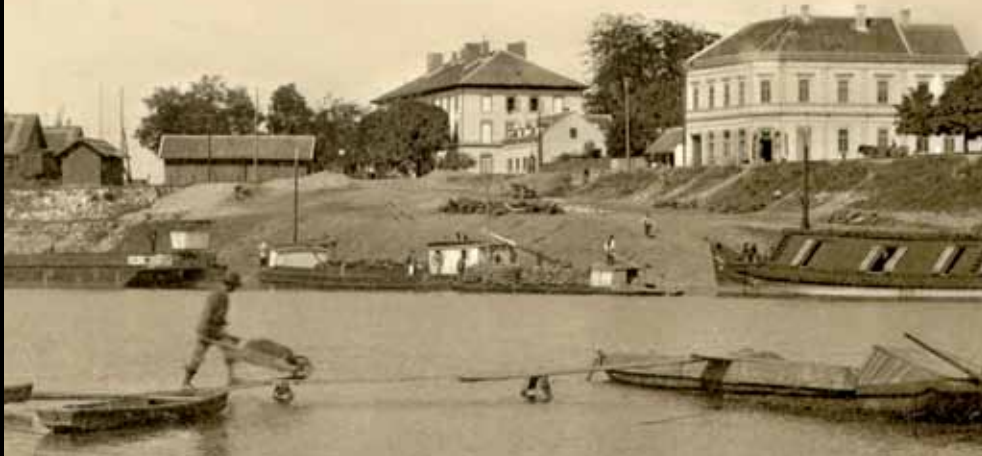
Sisak, 1910. godine: pogled na brodove u luci, u pozadini je carinarnica (GMS 22810)