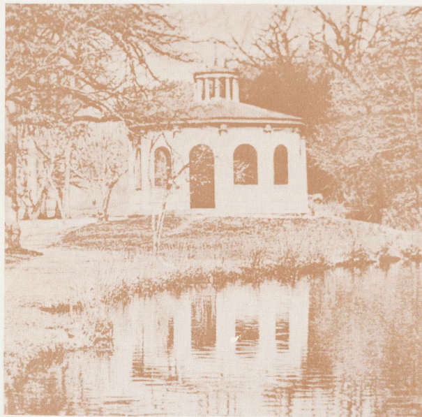
Paviljon kod donjeg jezera

Jedna od manjih zanimljivosti, ali koja je nekoliko desetljeća postojala u parku, bilo je jezerce u kojem su se, u zdravstvene svrhe uzgajale pijavice.