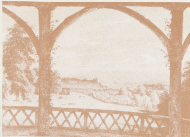
Pogled od paviljona »bellevue« prema mirnoj kolibi

Sa dvije sove i tri lisice u parku je utemeljen (1925.) Zoološki vrt, danas najstariji i najveći u Jugoslaviji.