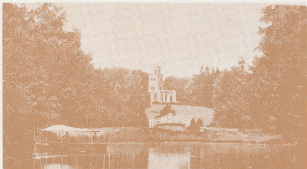
Parobrod na maksimirskom jezeru