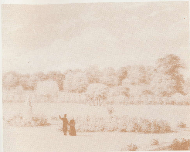
U cvjetnjaku ispred ljetnikovca