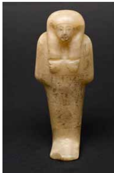
Figura od kamena žuto- smeđe nijanse. Po sebi ima egipatske natpise. Ruke su joj prekrižene na prsima. Također se polagala u grobove starih Egipćana kako bi im pomogla u svakodnevnim poslovima na onome svijetu.