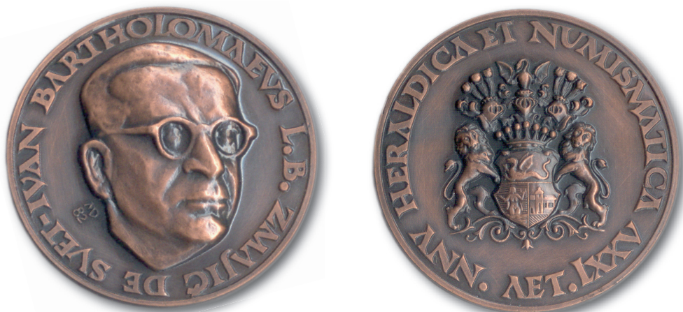
Sl. 9. Bartol Zmajčić, portretna medalja. Bronca, Damir Mataušić, 1982. (Arheološki muzej u Zagrebu)

služio latinskim jezikom, a zanimale su ga povijest, heraldika, numizmatika i genealogija. Zbog njihove vrijednosti neka djela tiskana su mu posthumno. Njegova je bibliografija priložena nekrologu. Bio je od drugoga razreda gimnazije pa do konca 2. svjetskoga rata i kolekcionar rimskog novca, a najviše ga je i zanimala antička numizmatika uopće, o čemu svjedoče na ovome mjestu tiskani tekstovi. Osobno je poznao Josipa Brunšmida i don Franu Bulića, a poput Benka Horvata, u mladosti dosta putuje svijetom te tako proučava antički novac u numizmatičkim kabinetima Londona, Beča i Berlina. U područje njegovih širokih interesa spadala je i austrijska carska, odnosno austro-ugarska carska i kraljevska vojska te je zahvaljujući svojem izvanrednom pamćenju bio najbolji hrvatski poznavalac svih garnizona i vojnih šematizama. (DOLENEC 1983; Enciklopedija hrvatske umjetnosti , II, Zagreb, 1996: 536; KRASNOV 1970; 1984).