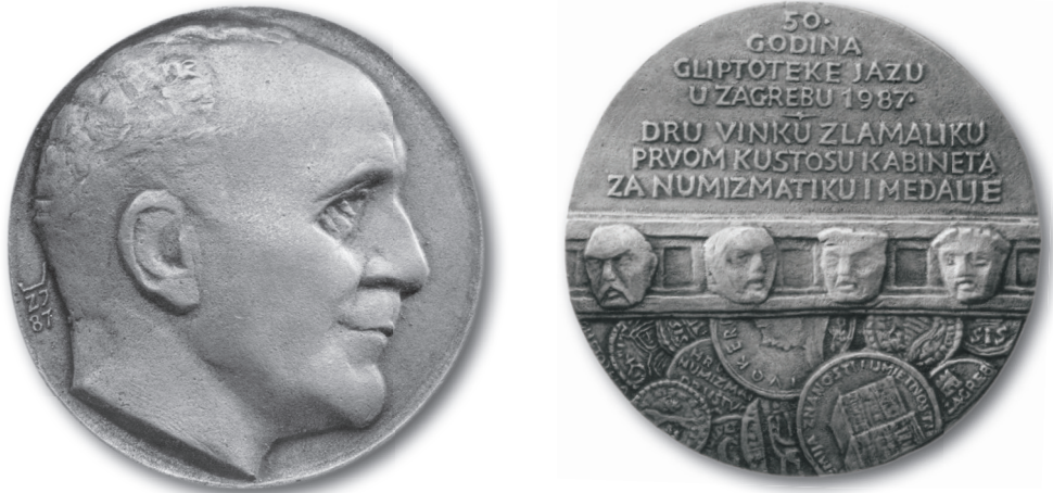
Sl. 8. Vinko Zlamalik, portretna medalja, bronca. Želimir Janeš, 1987.

su ga još poznavali znali su pripovijedati o njegovu odličnom smislu za humor s bosanskim »štihom«. Pokopan je na Mirogoju dana 12. V. 1962., a posmrtno slovo govorio je Vinko Zlamalik (ZMAJČIĆ 1962; ZMAJČIĆ – KRASNOV 1978: 8–9).