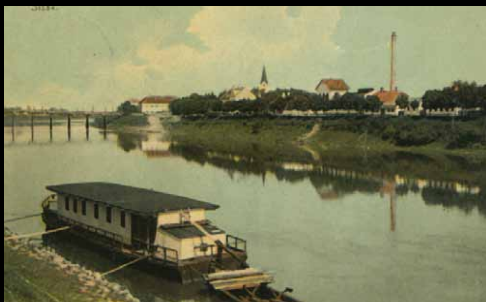
Sisak, 1908. godine: pogled uzvodno na drveni most (GMS 712)