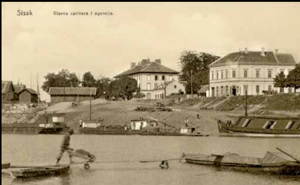
Sisak, 1910. godine: pogled na brodove u luci, u pozadini je carinarnica (GMS 22810)