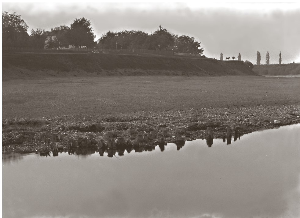
Fotografija snimljena s broda tijekom jaružanja, vjerojatno 1912. godine

Bukvić ovom popisu dodaje zanimljiv komentar, vezan uz mjesto koje sam naziva “prethistoričnim” te kaže kako su tamo pronašli nekoliko komada iz pečene ilovače kakve je sam imao prilike vidjeti na dužnosti u Dolini, prema čemu zaključuje da je tu na kupskoj obali definitivno postojalo “prethistorično” naselje. 467 Misli na područje današnjeg Pogorelca, s obzirom na to da je i lokalitet “Piloti” njegov integralni dio, a gdje je utvrđeno postojanje predrimskog naselja, iako na sjevernijem potezu prema Novom mostu. Zanimljivo je Bukvićevo laičko promišljanje o tom pitanju.