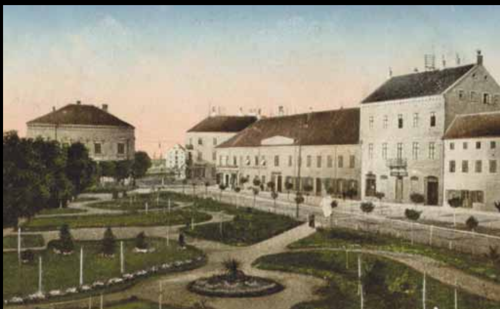
Sisak, 1915. godine: Glavni trg nakon uređenja parka (GMS 22749)