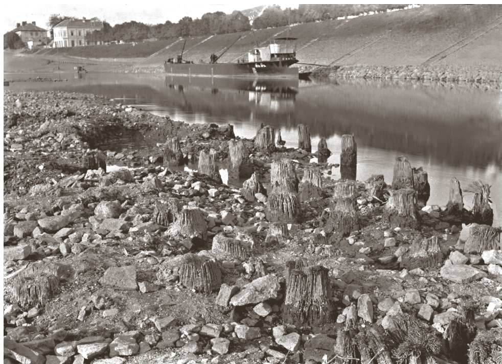
Fotografija jaružanja, vjerojatno snimljena 1912. godine

Konkurencije u otkupu se nije bojavao, jer je dobro plaćao game i zlato, a za druge stvari, kako navodi, se drugi ni ne otimaju. 469