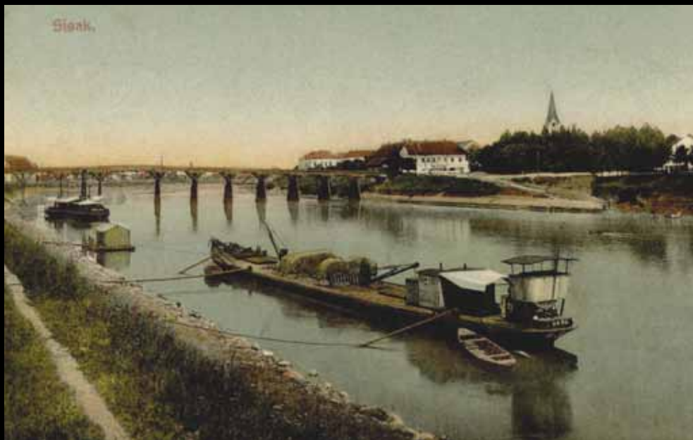
Sisak, 1910. godine: pogled na drveni most i skelu (GMS 22700)