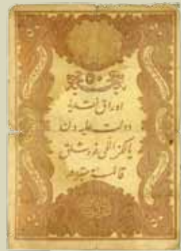
34. 20 kuruša (inv. G1385_1, G1404_9-14)