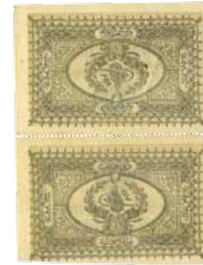
37. 1 kuruš (inv. G1385_2-9, G1434_13-19)