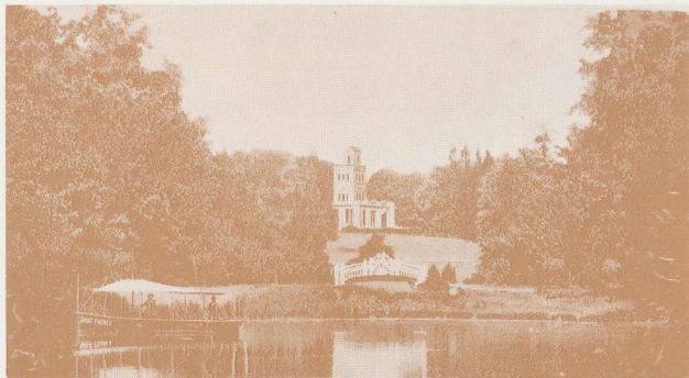
Parobrod na maksimirskom jezeru