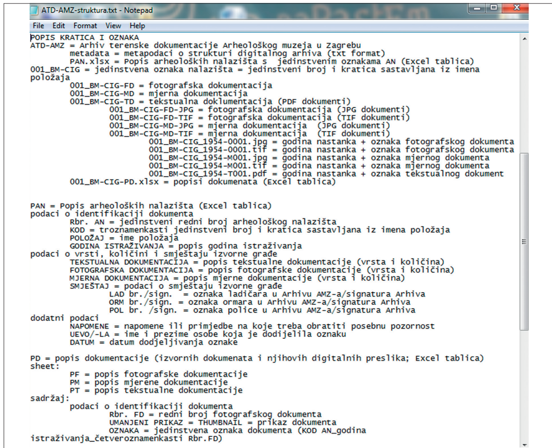
Slika / Figure 4: Metapodaci o strukturi arhiva / Metadata on archive structure (izradila / created by F. Sirovica).

mentacije koja je pohranjena u stvarnom i u digitalnom arhivu. Za svaku presliku slikovne građe u TIFF-u načinjena je i njezina manja kopija u JPEG formatu pa se unutar mapa, koje sadrže preslike fotografske i mjerne dokumentacije, dokumenti, ovisno o formatu, pohranjuju u zasebne mape koje, uz postojeće podatke, sadrže i oznaku formata. Sustav je, dakle, osmišljen na temelju jednostavne podjele dokumenata u tri segmenta, koja uvjetuje i način njihova evidentiranja i način njihove pohrane. Stoga bi razumljivost prikazanog pristupa i njegova usklađenost sa suvremenim razumijevanjem arheološkog podatka trebala osigurati dugoročnu razumljivost i upotrebljivost digitalnih dokumenata.