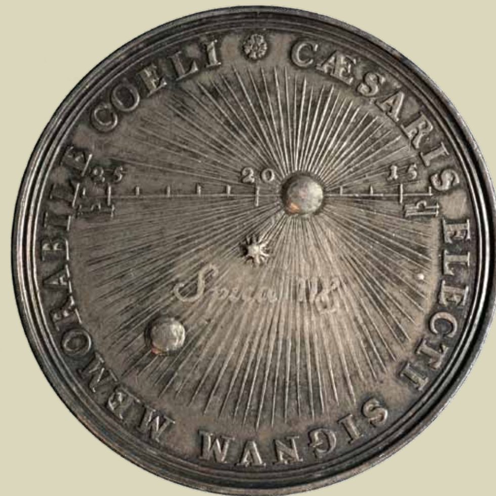
Izbor Karla VI. za cara 12. X. 1711. g.: medalja, rv.; Kat. 39

Osobito vrijedi istaknuti brončani medaljon carice Salonine otkupljen iste godine kod trgovca antikvitetima iz Beča Wilhelma Trinka (kat. 13). Na aversu medaljona prikazano je poprsje ove Galijenove supruge, a na reversu rukovanje cara i carice, uz natpis CONCORDIA AVGVSTORVM, sugerirajući preko bračnog sklada stabilnost same države.