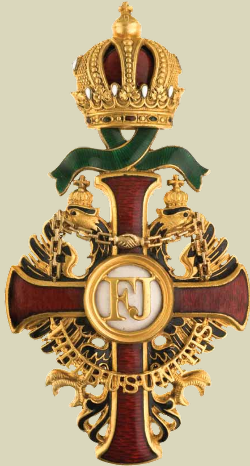
Ordenski znak Ordena Franje Josipa, II. stupanj – Oficirski križ s ratnom dekoracijom; Kat. 7.