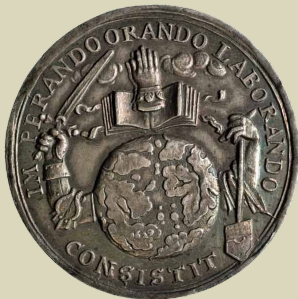
Želja za mirom; medalja; av.; Kat. 46.