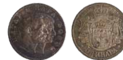
73. 5 dinara (inv. 29865)