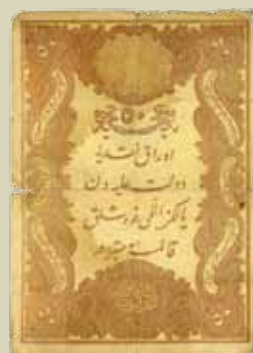
34. 20 kuruša (inv. G1385_1, G1404_9-14)