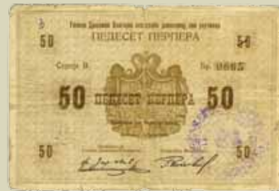
67. 50 perpera (inv. G2312_1)