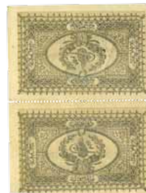
37. 1 kuruš (inv. G1385_2-9, G1434_13-19)