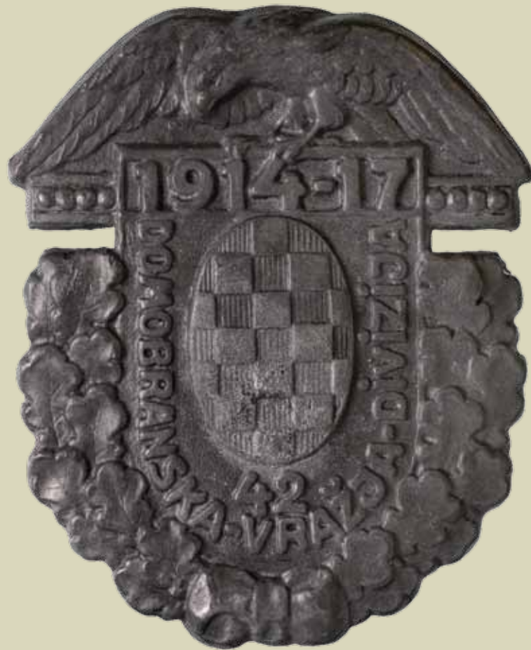
Oznaka za kapu 42. domobranske Vražje divizije.; Kat. 24.