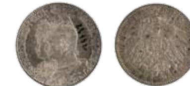
22. 10 pfeniga (inv. G1570_1-17)