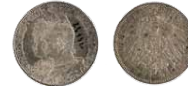
21. 2 marke (inv. 24192)