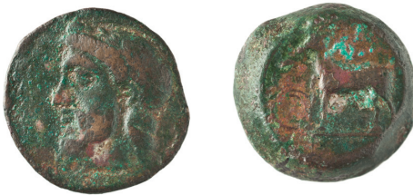
SLIKA 5. hemilitra Far prva polovica 4. st. pr. Kr. AMZ — A2434