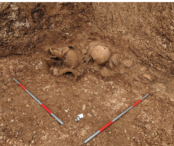
SLIKA 6. Koludrt — cisterna 2019. Skupina keramičkih posuda pronađenih na dnu cisterne in situ u sjevernom kutu. snimio M. Vuković