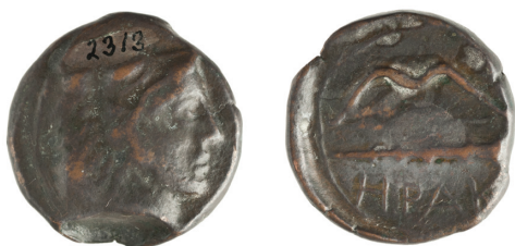
SLIKA 2. hemilitra Herakleja (Hvar?, Korčula?) druga polovica 4. st. pr. Kr. AMZ — A2313

Neki istraživači ne isključuju mogućnost da je knidska kolonija na Korčuli nosila ime Herakleja, grada o čijoj lokaciji i osnivaču također nema pouzdanih dokaza, mada postojanje polisa Heraklova imena na istočnoj obali Jadrana nedvojbeno potvrđuju pisani izvori, kao i serije emitiranoga novca. Ipak, zasad ne možemo sa sigurnošću ubicirati taj grad (Hvar se spominje kao mogućnost), a i emisije novca su po svemu sudeći bitno kasnije od pretpostavljenog vremena postojanja knidske kolonije, pa bi se postojanje Herakleje vjerojatno trebalo smjestiti u okviru 4. stoljeća. 26