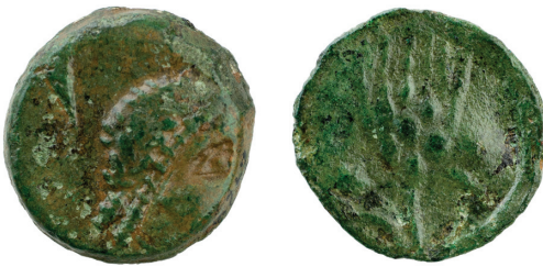
SLIKA 1. brončani novac Korkira (Lumbarda na Korčuli?) ca. 250.–230. pr. Kr. AMZ — A2429