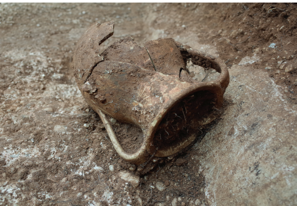
SLIKA 5. Koludrt — cisterna 2019. Keramička posuda tipa pelika pronađena na dnu cisterne.