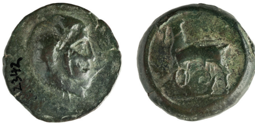
SLIKA 3. hemilitra Isa ca. 344.–325. pr. Kr. AMZ — A2342